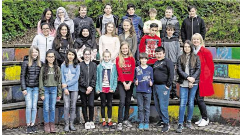
Team „Super 6“ von der Gustav-Heinemann-Gesamtschule Alsdorf beweist mit seinen 28 Mitgliedern, dass sich auch große Teams erfolgreich organisieren können.