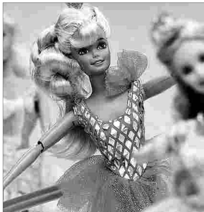
Kein dummes Blondchen? Bis zum 28. Oktober sind in Köln 320 Barbies in verschiedenen Berufskleidungen zu sehen.