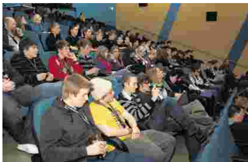
Spaß für alle: Nach der Siegerehrung markierte der Film „Madagascar 2“ den Höhepunkt des Nachmittags.