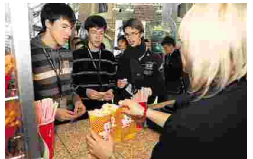
Süßes für Sieger: Drei „Weberknechte“ vom Pius-Gymnasium besorgen sich vor dem Start von „Madagascar 2“ die nötige Nervennahrung.