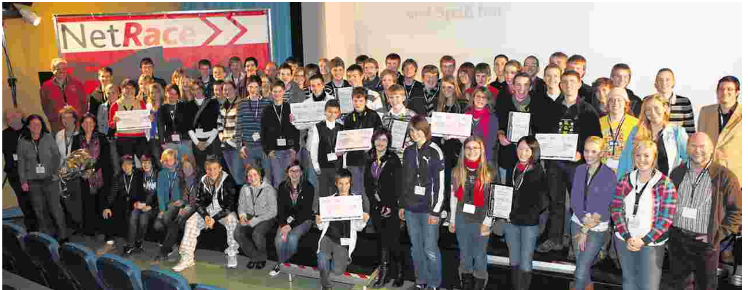
Vorhang auf für die Gewinner! Die Schüler und Projektlehrer der zehn besten Teams bei der Siegesfeier. In den Top Ten landeten Einhard- und Couven-Gymnasium (Aachen), Ganztagshauptschule Kogelshäuserstraße (Stolberg), Gymnasium Kreuzau, Pius-, Rhein-Maas- und Kaiser-Karls-Gymnasium (Aachen), Viktoriaschule (Aachen), Stiftisches Gymnasium (Düren) und das Gymnasium St. Ursula (Geilenkirchen).