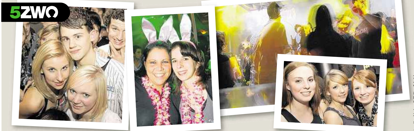
Die SZWO-Fotoscouts haben am Wochenende wieder ihre Kameras in Anschlag gebracht: Scout „Canna“ lichtete in Aachen die Besucher der Vorabiparty des St.-Ursula-Gymnasiums im B9 ab und war auf der Summer Splash Party im Nightlife. Fotoscout „Phil“ war in der Rockfabrik in Übach-Palenberg auf Tour.