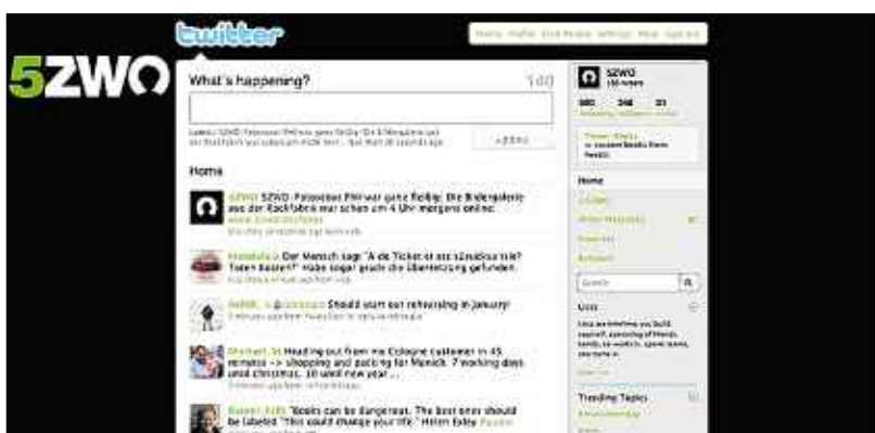
Plauderstrom: Die 140 Zeichen kurzen Mitteilungen auf Twitter - hier das Profil unserer Community 5ZWO - haben meist witzige oder harmlose Inhalte. Doch wer nicht aufpasst, kann Ärger bekommen.

„Ganze Streams könnten diese Fallhöhe aber durchaus erreichen“, sagt der IT-Anwalt. Wer also zum Beispiel als Follower von einem anderen Nutzer jeden Tag spannende Links erhält, lässt eines lieber bleiben: sie zu archivieren und gebündelt weiterzubreiten. (dpa)