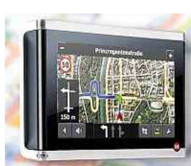
Navigationsgerät Falk Vision 700.

Unter allen Einsendern mit den richtigen Antworten verlosen wir ein Navigationsgerät Falk Vision 700. Das Gerät, dessen Design mehrfach ausgezeichnet wurde, bietet mit Luftbildern und 3D-Darstellung beste Übersicht. Die „Guided Tours“-Funktion leitet den Fahrer entlang bekannter Sehenswürdigkeiten und malerischer Landschaften. Zwei Jahre lang ist außerdem das neueste Kartenmaterial inbegriffen.