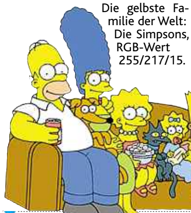
Die gelbste Familie der Welt: Die Simpsons, RGB-Wert 255/217/15.

Doch nicht nur die Schüler waren in dieser Runde im Netrace-Fieber. Auch die Leser unserer Zeitung suchten mit Hilfe von Google, Wikipedia & Co. die Antworten zum fünften Aufgabenblock der