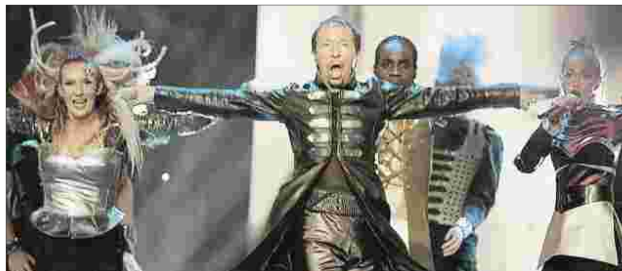
Mitreibende Show: Den Sänger DJ Bobo werden die Sieger beim „Meet & Greet“ treffen