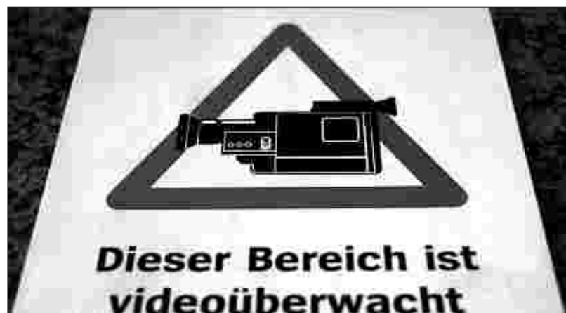
Segen oder Schreckensszenario? Die öffentliche Videoüberwachung soll in Aachen und Düren 2008 eingeführt werden.

war die friedlichste seit Jahren, wofür einige Dürener dem Landrat kräftig auf die Schulter klopfen haben, aus Dankbarkeit.