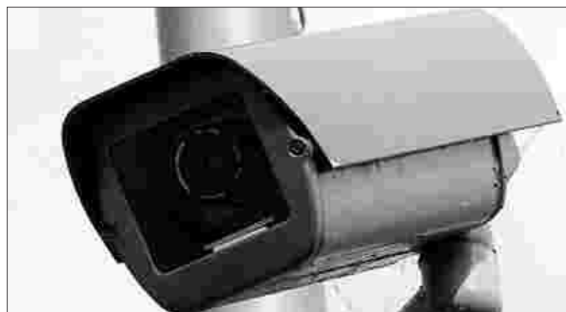
Segen oder Schreckensszenario? Die öffentliche Videoüberwachung soll in Aachen und Düren 2008 eingeführt werden.