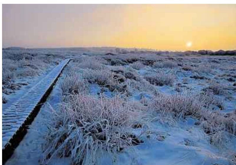
„Im Torfmoor“ heißt dieses Motiv von 5ZWO-Mitglied „Winfried“.

Wer mitmachen möchte und noch kein 5ZWO-Mitglied ist, kann sich auf www.5zwo.de ein kostenloses Mitgliedsprofil zulegen. Darin lassen sich bis zu 20 Bilderalbum mit jeweils bis zu 40 Fotos anlegen.