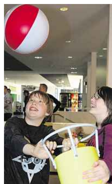
Abgehoben: Diese beiden Stolberger Schüler hatten Spaß mit der Luftkanone, die den Ball stets in stabiler Position hielt.