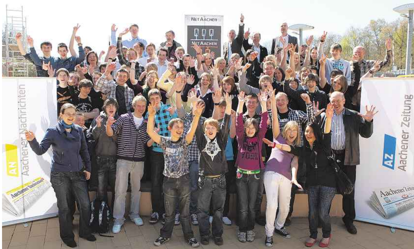
Die Hände zum Himmel: Schüler und Lehrer der zehn besten Teams unserer Internetrallye Netrace zeigen dem Fotografen ihre gute Laune. In der „Continium Discovery World“ im niederländischen Kerkrade wurde jetzt endlich die genaue Platzierung der Siegergruppen bekanntgegeben.