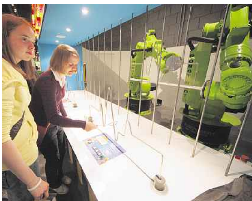
Mensch gegen Maschine: Nach der Siegerehrung wartete auf die zehn Siegerteams ein spannender Nachmittag in der „Continium Discovery World“. Bei diesem Experiment ging es darum, schneller als der Roboter einen bestimmten Bewegungsablauf auszuführen.