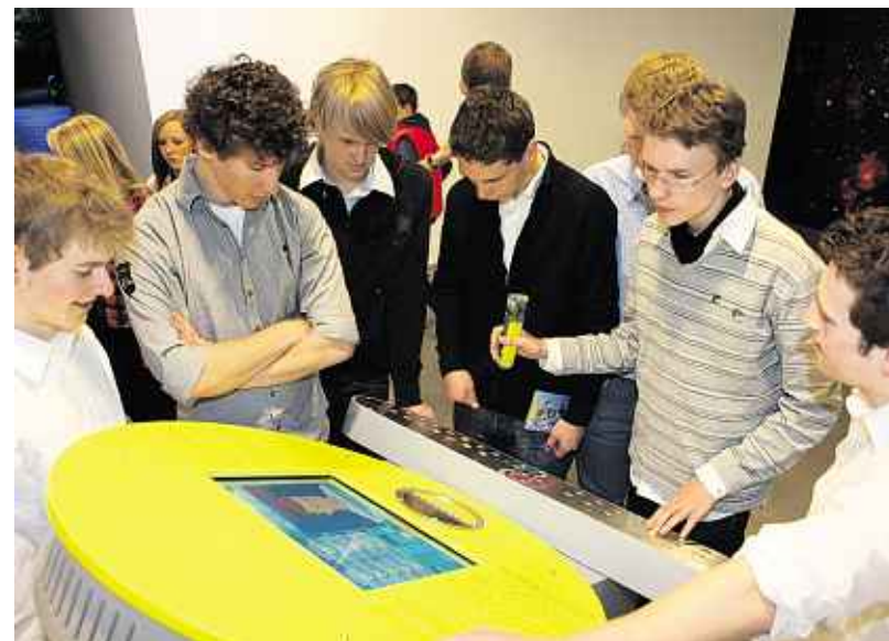
Entdeckergeist: Die Netrace-Profis vom Team „HÜW“ des Aachener Einhard-Gymnasiums – Sieger des Vorjahres und nun erneut auf Platz 4 – an einem Mitmach-Experiment im „Continium“.

Bei einer zweiten kleinen Rallye nach der Netrace-Siegerehrung hatten sie dann reichlich Gelegenheit, das Terrain zu erkunden. Der erste Preis, ein Besuch in der VIP-Loge von NetAachen während eines Alemannia-Heimspiels, ging an „Nano Dobali“. Den zweiten Gewinn, einen Erlebnistag beim CHIO-Reitturnier, räumten die „Blue's Clues“ ab. Aber im Gewinn haben sie ja jetzt Routine.