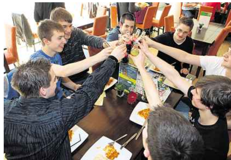
Auf den Erfolg! Die Geilenkirchener „Speedies 2.0“ feierten ihren zweiten Einzug in die Top Ten des Netrace.