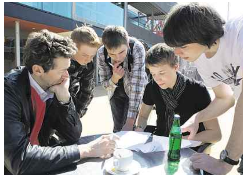
Beratungsbedarf: Die kniffligen Fragen der Extra-Rallye nach der Siegerehrung durch das „Continium“ sorgten für Extra-Kopfzerbrechen. Hier rätselt das Team „Überraschung“ vom Gymnasium Zitadelle aus Jülich.