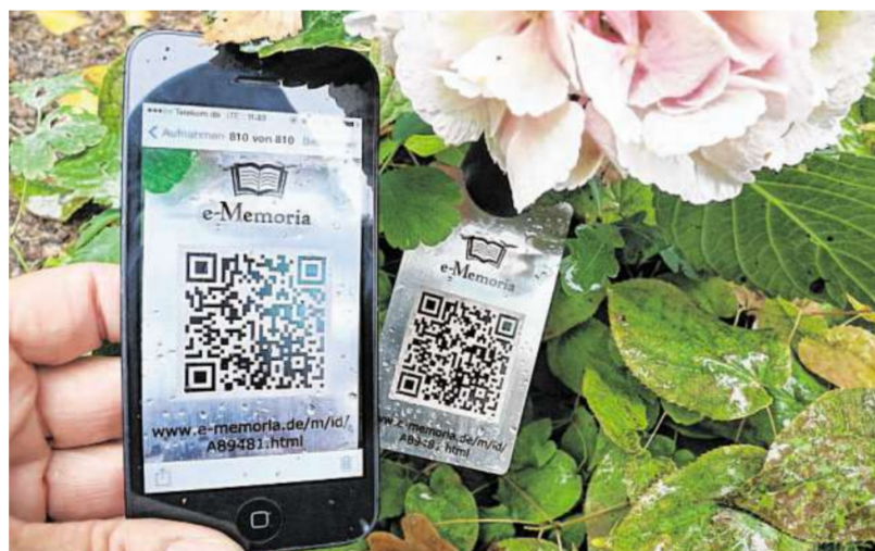
Ein QR-Code am Grab der DDR-Bürgerrechtsaktivistin Bärbel Bohley auf dem Dorotheenstädtischen Friedhof in Berlin.